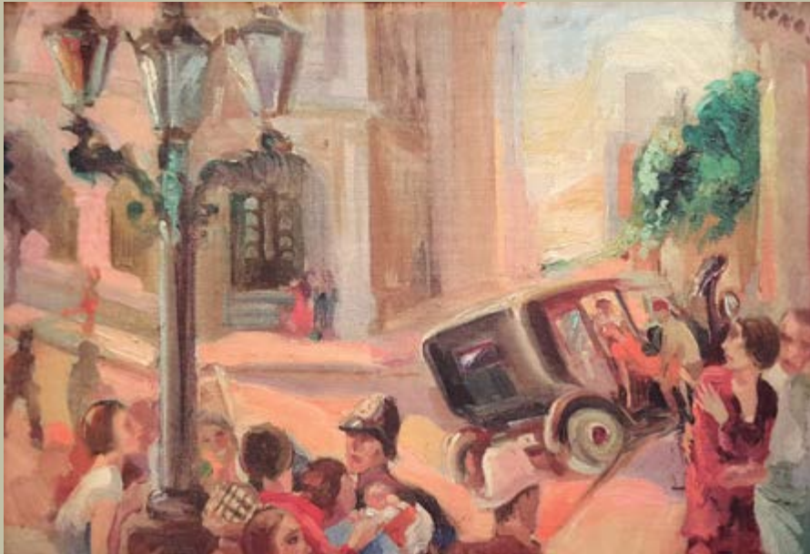
Amadeo Roca, Prestant socors a les víctimes d'un accident automobilístic , 1928