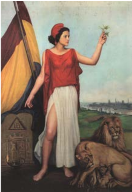
Alfred Claros, Alegoría de la República , 1936

Con la llegada de la República apremia configurar una imagen y una estética propia de este período. Los artistas del momento generan nuevas imágenes que hoy podemos identificar con ciertos cambios sociales, políticos y económicos.