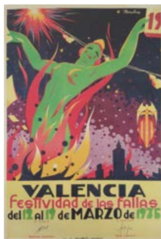
Manuel Monleón, València Fiestiva de les Falles , 1935

llas y ferias fueron tipologías que tuvieron un desarrollo en cuanto formato, forma y contenido. Las imprentas del momento llegaron a producir grandes dimensiones con muy buena calidad. Las formas y los contenidos fueron muy diversos, formas clásicas con contenidos modernos y viceversa.