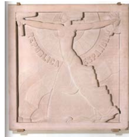
Ricard Boix, República Española , 1932

Cuentan los artistas del momento, que los gobernantes de la Segunda República no impusieron oficialmente ningún canon artístico y, en consecuencia, se pudieron perpetuar con normalidad diversas ejecutorias tradicionales . Así, la apertura hacia las nuevas corrientes artísticas que triunfaban en esos momentos, como el Art Decó, estarán presentes en muchas de las obras del momento.