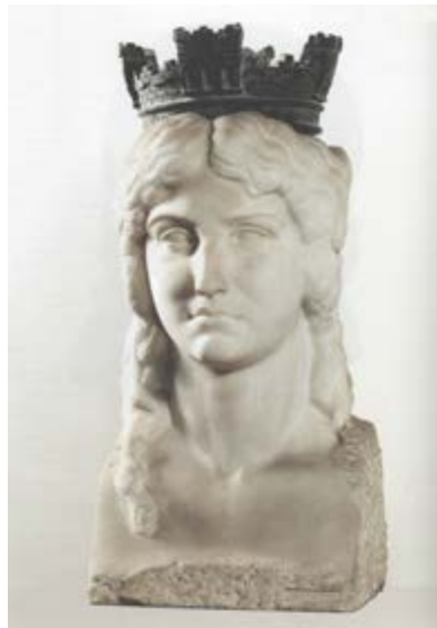
Ignacio Pinazo, 14 d'abril (Alegoría de la República) , 1932