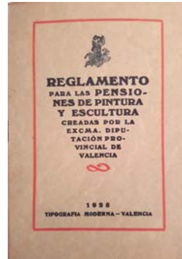
Reglamento de las pensiones de pintura y escultura creadas por la Excmá Diputación de Valencia, 1925.

¿Sabías que la Diputación de Valencia sigue concediendo premios y becas para apoyar y promocionar a jóvenes artistas valencianos?