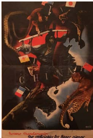
Josep Renau, Nové manament. No cobejaràs els béns aliens , 1934.