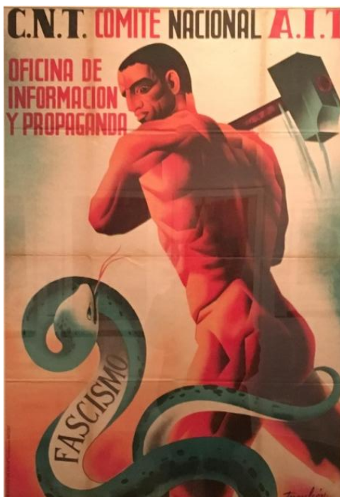
Manuel Monleón, Feixisme , 1936

Considera que el cartel o pasquín que tienes que crear debe tener un mensaje conciso y actual. Presta especial atención a los recursos gráficos y en los mensajes que transmiten los carteles originales.