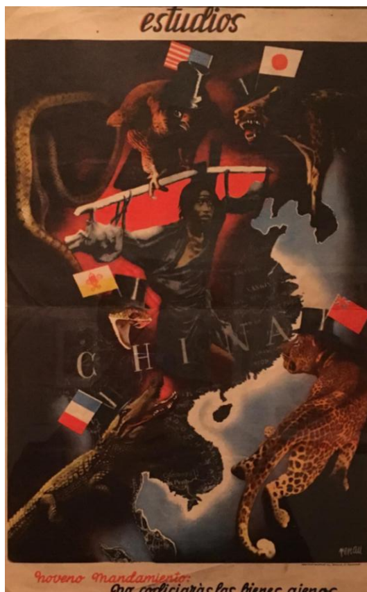
Josep Renau, Nové manament. No cobejaràs els béns aliens, 1934

Josep Renau nació en Valencia en el año 1907. Murió en Berlín en 1982.